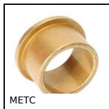
METC Cuscinetto a collare, Bronzo autolubrificante