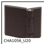
CHA1056_U20 Cerniera ad avvitare, Sezione 76x50