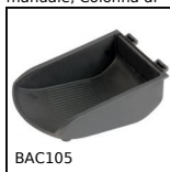
BAC105 Contenitore a becco, 8mm