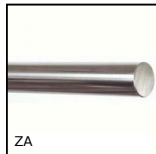
ZA Albero per guida lineare, Acciaio temprato