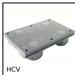
HCV Sistema di guida su binario a V Simple Select®, Carrello