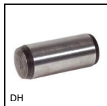
DH Spina cilindrica, standard DIN 6325