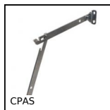
CPAS Asta snodata con fermo di sicurezza, Apertura verso l'altro