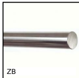
ZB Albero per guida lineare, Inox temprato