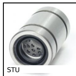
STU Boccola a sfere lineare e rotativa, Acciaio