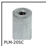
PLM-20SC Magnete cilindrico di fermo filettato, Magnete di fermo maschiato