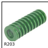
R203 Molla per stampi ISO10243, Leggero