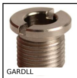
GARDLL Bussola portamaschi, Acciaio o Inox Acciaio nichelato or