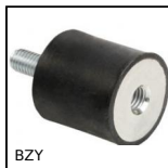
BZY Antivibrante elastico cilindrico, Acciaio