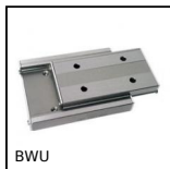
BWU Guida lineare di precisione, da 1510 N a 10500 N