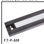
F7-P-AM Visualizzatore multifunzione, Banda magnetica