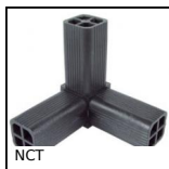
NCT Giunto di collegamento, Ad