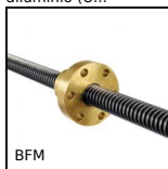
BFM Dado trapezoidale, Bronzo - 1 filetto