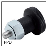
PPD Pistoncino a molla, Per lamiera