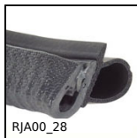
RJA00_28 Guarnizione in gomma, Da agganciare