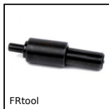
FRtool Attrezzi per inserti filettati, Attrezzo di posa