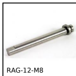
RAG-12-M8 Guida di scorrimento a rotelle, Sistema di ancoraggio