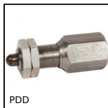
PDD Pressore a molla sensore di rilevamento, Con attacco per sensore