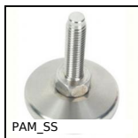
PAM_SS Piede snodato con base lamiera, Ø 30 &