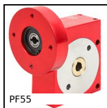
PF55 Riduttore a ruota e vite senza fine, fino a 57 Nm