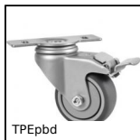
TPEbd Ruota per profili alluminio, Girevole con freno