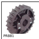
PR881 Ruota di rinvio, Serie 881