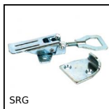
SRG Chiusura a leva regolabile, Corsa da 78mm a 90mm