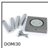
DOMI30 Accessori di collegamento, Piatto girevole