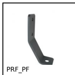
PRF_PF Elementi di ancoraggio, Staffa di fissaggio