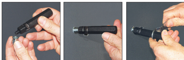
Esempio di messa in opera