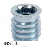
INS150 Inserto auto-maschiante a passo grosso, Con colletto filetto largo