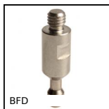
BFD Perno ad innesto per boccia, +180°C