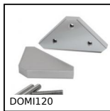
DOMI120 Kit di raccordo, Kit di raccordo XZ