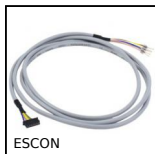
ESCON Accessori per variatore di velocità 5A, Kit 4 cavi motore DC