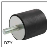
DZY Piedino antivibrante cilindrico, Acciaio