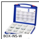
BOX-INS-W Inserto autofilettante, Box kit - Per legno