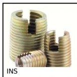
INS Boccola autofilettante acciaio, acciaio