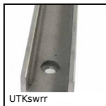
UTKswrr Guida lineare Utilitrack®, Profilo guida a V