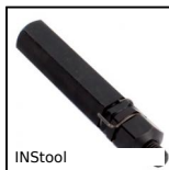
INSTool Boccola autofilettante - Attrezzo, Strumento di posa