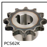
PCS62K Pignone a catena dentatura temprata, 15.875mm (DIN10B-1)