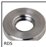
RDS Rondella di sicurezza Hygienic Usit®, Inox