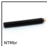
NTMbr Grano punta in ottone, punta in ottone