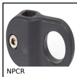
NPCR Morsetto porta fotocelle, Regolabile