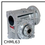
CHML63 Riduttore a ruota e vite senza fine, fino a 138 Nm - Con limitatore ...