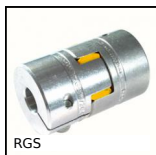
RGS Giunto senza gioco Rotex® GS, da 0.5 a 190Nm