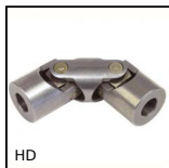
HD Giunto cardanico doppio ad aghi, Sollecitazioni intense