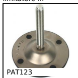
PAT123 Piede snodato con base lamiera Ø123, Ø 123