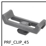
PRF_CLIP_45 Clip di fissaggio per cavi per profili alluminio, Per canalina di ca...