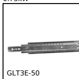
GLT3E-50 Guide telescopiche acciaio, Estensione extra