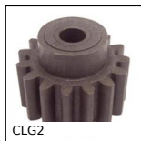
CLG2 Ingranaggio dritto in plastica stampata , Nylon stampato