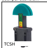
TCSH Tenditore per catena automatico, Con pattino