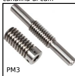
PM3 Vite senza fine, Acciaio non temprato