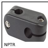
NPTR Morsetto, Regolabile