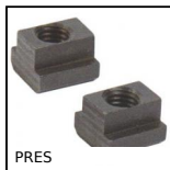
PRES Accessori per pressa PRES-3HR e PRES-4HR, Coppia di dadi per scanala...