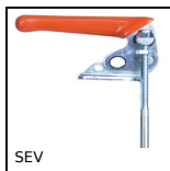
SEV Attrezzo di bloccaggio a tirante, A tirante