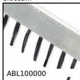
ABL100000 Spazzola antistatica, Per superfici fragili