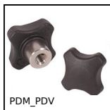
PDM_PDV , by metal detectors