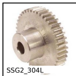
SSG2_304L Ingranaggio dritto Inox, Inox 304L