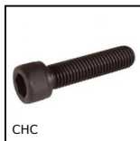
CHC Vite a testa cava esagonale CHC, Acciaio classe 12.19