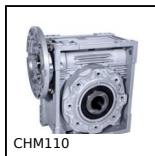
CHM110 Riduttore a ruota e vite senza fine, fino a 980 Nm