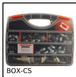
BOX-CS Fascette di serraggio, Valigetta di fascette acciaio