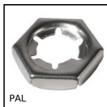
PAL Dado di sicurezza, Per bloccaggio assiale