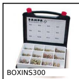
BOXINS300 Inserto autofilettante, Box kit per materiali duri