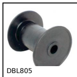
DBL805 Rotella per catena, Serie 805