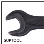
SUPTOOL Attrezzo di montaggio per calettatori, Per calettatori di bloccaggio