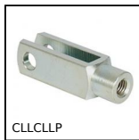
CLLCLLP Forcella serie lunga, Lunga acciaio