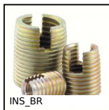
INS_BR Boccola autofilettante Ottone, Ottone