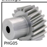
PHG05 Ingranaggio elicoidale ad assi paralleli,