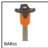
BABss Perno autobloccante inox 303, Inox 303