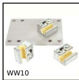
WW10 Guida Drylin® W, Carrello