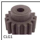
CLG1 Ingranaggio dritto in plastica stampata , Nylon stampato