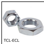
TCL-ECL Piede massiccio per carichi pesanti, Dado di regolazione