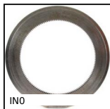
INO Ingranaggio interno, Acciaio 20NCD2