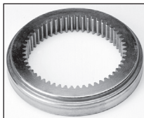
IN : Acciaio