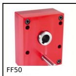
FF50 Riduttore ad alberi paralleli, da 111 a 425 Nm