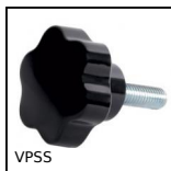
VPSS Volantino a 6 lobi, Duroplast - Inox