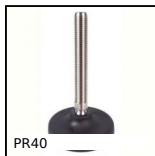
PR40 Piede fissabile con snodo - poliammide, Ø 50