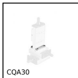
CQA30 Accessori per slitta di regolazione miniatura, 30