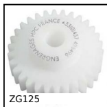
ZG125 Ingranaggio dritto in plastica, Plastica lavorata (delrin)