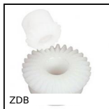
ZDB Ingranaggio conico in plastica, 2:1