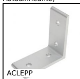
Angolare, 4 fori