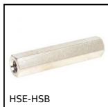
Distanziatore esagonale, Ottone