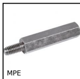
Distanziatore esagonale, Acciaio