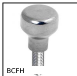
Pomello a fungo Hygienic Usit®, Con perno filettato e collare alto