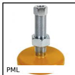
Piede massiccio per carichi pesanti, Ø 100, 120 o 150