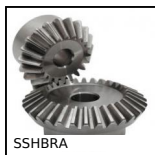
Ingranaggio conico inox, 1,5:1 2:1 3:1