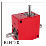
Rinvio angolare a T, da 0.66 a 1.77 Nm