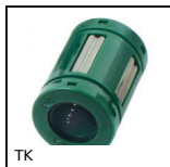
Manicotto a sfere autoallineante Topball, Autoallineante,