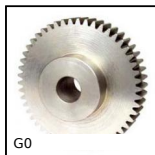
Ingranaggio dritto acciaio, Acciaio 20NCD2