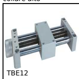
Economic mini-table with trapezoidal