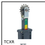
TCXR Tenditore per catena automatico, Con pignone acciaio