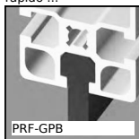
PRF-GPB Guide for aluminium profile, Rail for 8mm wide slots