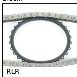
RLR Tenditore per catene Roll-Ring®, Roll- Ring® Self-adjusting