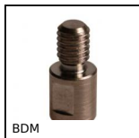
BDM Perno ad innesto per bocca magnetica, Bloccaggio magnetico rapido ...