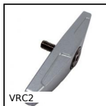
VRC2 Staffa di bloccaggio 2 lati, 2 lati