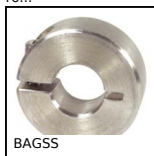
BAGSS Anello di bloccaggio inox, Inox