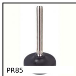
PR85 Piede fissabile con snodo - poliammide, Ø 83