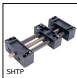
SHTP Tavola lineare Drylin®, Economica