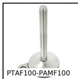
PTAF100-PAMF100 Piede fissabile con base lamiera Ø100, Ø 100