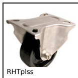
RHTplss Ruota alte temperature, fino a 200kg