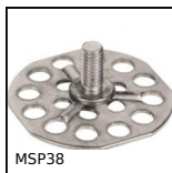
MSP38 Inserto con piastrina a incollare