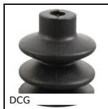
DCG Ventosa, nitrile