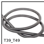
T39_T49 Molla di trazione al metro inox, al metro