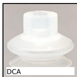
DCA Ventosa, silicone