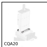
CQA20 Accessori per slitta di regolazione miniatura, 20