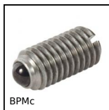
BPMc Pressore a molla con intaglio e puntale a sfera, Corpo inox 303