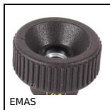
EMAS Antistatic knurled nut, Antistatic