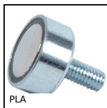
PLA Magnete, Magnete piatto con filettatura