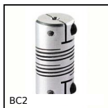
BC2 Panamech, Multi- Beam, Alluminio - con ganascia di serraggio