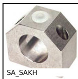
SA_SAKH Supporto per manicotto, Chiuso - carico leggero