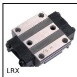
LRX Guida lineare a rulli, Carello - da 9410 N a 101000 N