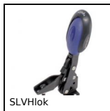
SLVHlok Bloccaggio a leva, A leva verticale / base orizzontale