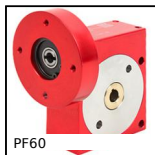
PF60 Riduttore a ruota e vite senza fine, fino a 118 Nm