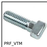
PRF_VTM Fissaggio, Vite testa martello