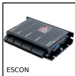
ESCON Variatore di velocità 5A, 5 A