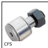
CFS Perno folle mini, Miniatura