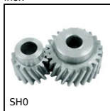
SH0 Ingranaggio elicoidale ad assi paralleli , Acciaio 20NCD2