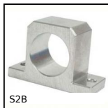
S2B Supporto corto per manicotto chiuso a sfere, Chiuso - Corto