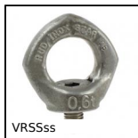
VRSSss Anello di sollevamento, Orientabile maschio inox