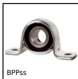
BPPss Supporto ritto in lamiera con cuscinetto inox, Inox