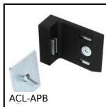
ACL-APB Sistema di chiusura, Fermporta magnetico