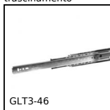
GLT3-46 Guide telescopiche acciaio, Estensione totale