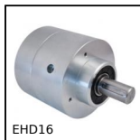
EHD16 Riduttore coassiale, da 210 a 380 Nm