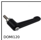
DOMI120 Accessori di collegamento, Leva di serraggio