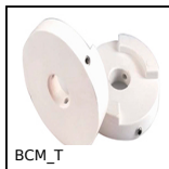
BCM_T Elemento di trascinamento, Elemento di trascinamento