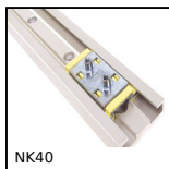
NK40 Guida mini Drylin® N, Larghezza 40 mm