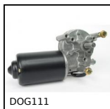
DOG111 Motoriduttore DC 12V e 24V DC, da 1.5 a 6 Nm