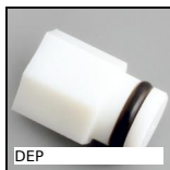
DEP Attrezzi Hygienic Usit® and Hygienic Design®, Inserto di