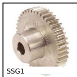
SSG1 Ingranaggio dritto Inox, Inox 304L