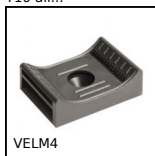
VELM4 Supporto avvitabile per rotolo a strappo fermacavi,