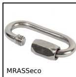
MRASeco Maglia rapida economica, Inox