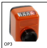
OP3 Indicatore di posizione digitale (N. di giri), 4 cifre