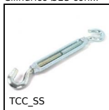
TCC_SS Tenditore, Inox