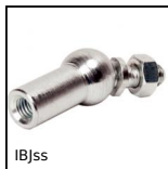
IBjss Snodo angolare, Inox