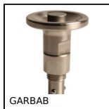
GARBAB Perno di bloccaggio rapido manuale, A sfere