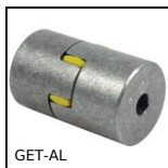
GET-AL Giunto elastico alluminio serie eco., Alluminio