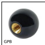
GPB Maniglia a tirante, Con inserto ottone