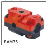
RAM35 Riduttore manuale, Rinvio angolare