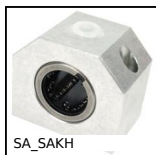
SA_SAKH Supporto per manicotto, Chiuso - carico leggero