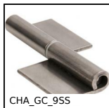
CHA_GC_9SS Cerniera (tutto inox), A saldare