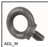
ADL_M Anello di sollevamento, Acciaio