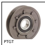
PTGT Puleggia folle, Per cinghia trapezoidale