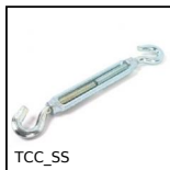
TCC_SS Tenditore, Inox