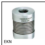
EKN Giunto a soffietto Gerwah®, da 0.5 a 12Nm