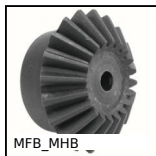
MFB_MHB Ingranaggio conico in plastica stampata , 1.5:1