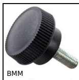
BMM Manopola, zigrinata