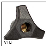
VTLF Volantino a 3 lobi, Poliammide - Ottone