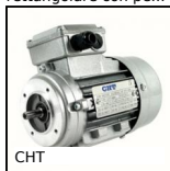
CHT Motore AC asincrono trifase, 0.55 a 1.1kW