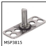
MSP3815 Inserto con piastrina a incollare Masterplate®, rettangolare con pe...