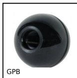
GPB Maniglia a tirante, Maschiatura modellata