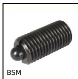
BSM Pressore a molla con esagono incassato,