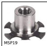
MSP19 Inserto con piastrina a incollare Masterplate®, Cilindrico con inse...