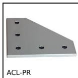
ACL-PR Elementi di giunzione, Collegamento a 90°