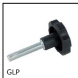
GLP Volantino a 6 lobi filettato, Tecnopolimero - Inox