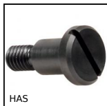
HAS Rondella girevole, Vite con spalla a testa piatta con intaglio