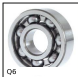
Q6 Cuscinetto radiale a sfere, Acciaio