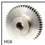
HG6 Ingranaggio dritto acciaio , Acciaio 20NCD2