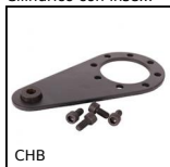
CHB Braccio di reazione, Braccio di reazione per riduttori CHB