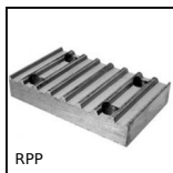
RPP Piastra di giunzione per cinghia RPP, RPP8