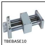
TBEBASE10 Economic mini-table with trapezoidal leadscrew, 1kg