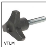
VTLM Volantino a 3 lobi, Poliammide - Acciaio