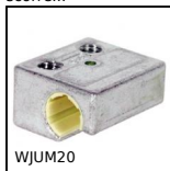
WJUM20 Pattino Drylin® W, Pattino