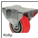
RURp Ruota fissa con piastra, Poliuretano - Mozzo alluminio (Ultra scorre...