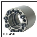
RTL450 Calettatore di bloccaggio, Coppia elevata