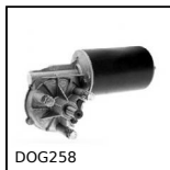
DOG258 Motoriduttore DC 12V e 24V DC, da 12 a 15 Nm