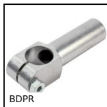
BDPR Braccio di reazione, Rigido