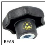
BEAS Manopola, stella, antistatico