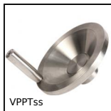
VPPTss Volantino pieno con impugnatura girevole, Inox 304