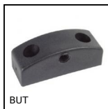
BUT Accessori per pannello, Arresto per pannello