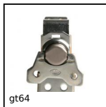
gt64 Chiusura a farfalla, Tolleranze di montaggio normali