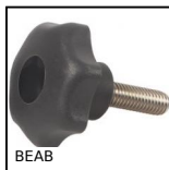
BEAB Manopola, stella, antibatterico