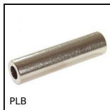
Distanziatore cilindrico, Ottone