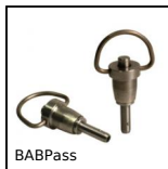
Perno autobloccante inox temprato ad anello, Con impugnatura ad