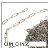
Catena dritta a maglie lunghe, Inox