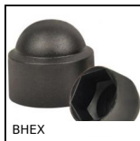
BHEX Tappo di protezione esagonale, Tecnopolimero nero