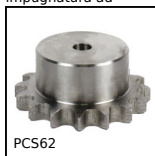
Pignone a catena - acciaio, 15.875 (DIN 10B-1)