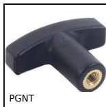
PGNT Impugnatura termoplastica a T, Con inserto maschiato