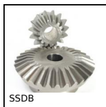
SSDB Ingranaggio conico inox, 2:1