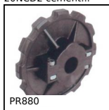
Ruota di rinvio, Serie 880