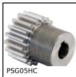
Ingran. dritto di precisione trattato skiving, Acciaio 20NCD2 cement...