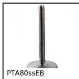
PTA80ssEB Piede snodato con base stampata Ø80, Piede snodato