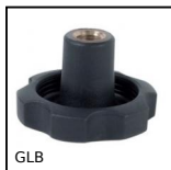
Volantino a 6 lobi filettato, Tecnopolimero - Inox