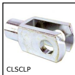
Forcella serie corta, Corta acciaio