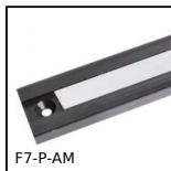
F7-P-AM Visualizzatore multifunzione, Banda magnetica