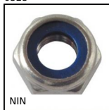
NIN Dado autofrenante , Acciaio