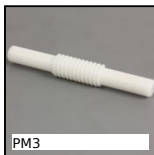
PM3 Coppia ruota e vite senza fine, Plastica lavorata (delrin)