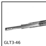
Guide telescopiche acciaio, Estensione totale