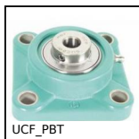
Cuscinetto a flangia quadrata polimero inox, Polimero e inox