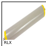
Rullo folle plastica, PVC