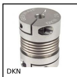
Giunto a soffietto Gerwah®, da 0.4 a