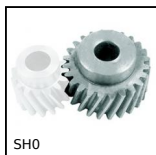
Ingranaggio elicoidale ad assi paralleli, Acciaio 20NCD2