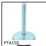
Piede snodato con base stampata Ø150, 40000N