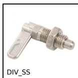
Pistoncino a molla, Bloccabile - Inox