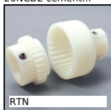
RTN Giunto Bowex®, a dentatura bombata,