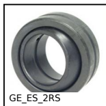
GE_ES_2RS Snodo sferico, acciaio/acciaio e guarnizioni di tenuta