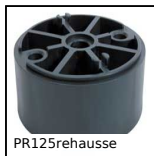
PR125rehausse Extension for articulated foot Ø123, Ø 123