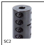
SC2 Giunto rigido in 2 parti, Ganascia di serraggio