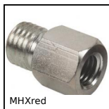
MHXred Manicotto di riduzione, Esagonale -