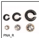
PNA_R Giunto elastico PERIFLEX, Collare di ricambio