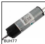
BUH77 Motoriduttore DC 12V e 24V DC, da 0.1 a 2 Nm