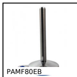
PAMF80EB Piede snodato con base stampata fissabile Ø80, Piede snodato