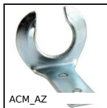
ACM_AZ Aggancio per tirante chiusura in gomma, Aggancio