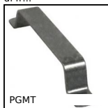
PGMT Maniglia a ponte, Acciaio