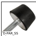
D-PAR_SS Piedino antivibrante parabolico, inox