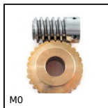
M0 Coppia ruota e vite senza fine , Bronzo