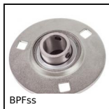
BPFss Supporto a flangia tonda a carico leggero inox, Inox