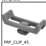
PRF_CLIP_45 Clip di fissaggio per cavi per profili alluminio, Per canalina di ca...