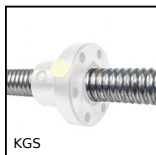
KGS Vite a ricircolo di sfere al metro, Vite a sfere rullata, al metro