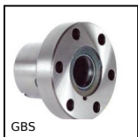
GBS Dado per vite a sfere, Dado flangiato