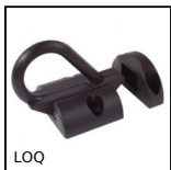
LOQ Accessori per porte, Fermaporte a scatto