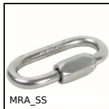
MRA_SS Maglia rapida, Inox