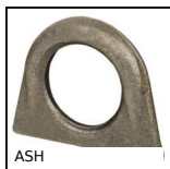
ASH Anello di sollevamento, dritto a