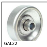
GAL22 Ruota per trasportatore, Acciaio zincato