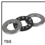
TB8 Cuscinetto assiale a rulli cilindrici, Acciaio