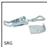
SRG Chiusura a leva regolabile, Corsa da 77,3mm a 83mm