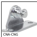
CNA-CNG Staffa di montaggio per molla a gas, Staffa di montaggio a squadra p...