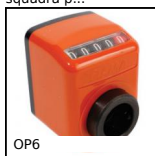
OP6 Indicatore di posizione digitale (N. di giri), 5