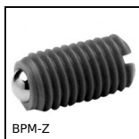
BPM-Z Pressore a molla con intaglio e puntale a