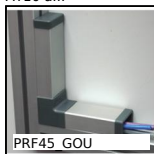
PRF45 GOU Canalina, Accessori