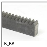
R_RR Cremagliera sezione stretta, Acciaio