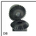
DB Ingranaggio conico in acciaio, 2:1