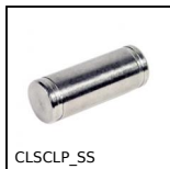
CLSCLP_SS Perno serie corta inox, Inox - serie corta