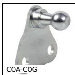
COA-COG Staffa di montaggio per molla a gas,