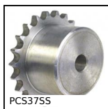
PCS37SS Pignone a catena - Inox, 9.525 (DIN)