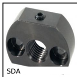
SDA Pistoncino a molla - Supporto, fissaggio parallelo alla serratura