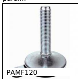
PAMF120 Articulated fixable foot, pressed bolt-down base Ø 120, Ø 120