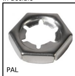
PAL Dado di sicurezza, Per bloccaggio assiale