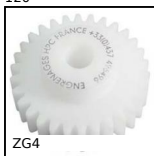
ZG4 Ingranaggio dritto in plastica, Plastica lavorata (delrin)