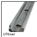
UTKswr Guida lineare Utilitrack®, Profilo guida a V