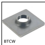
BTCW Tappo inox per tubo quadrato, A saldare