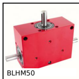
Tavola di posizionamento a passo inverso manuale, 2kg