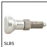
SLBS Pistoncino a molla, Tutto inox