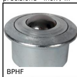
BPHF Sfera portante a incastro con flangia, Forte