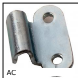
AC Piastrina di riscontro, 15mm