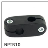
NPTR10 Connettore rinvio d'angolo, Regolabile