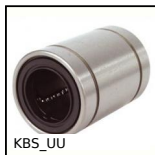
KBS_UU Manicotto chiuso a sfere inox di precisione, Di precisione - inox / ...