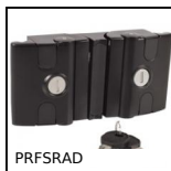
PRFSRAD Sistema di chiusura per profili alluminio, Serratura doppia