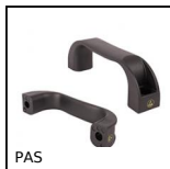
PAS Maniglia a ponte, Reinforced PA thermoplastic