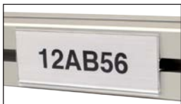
Mounted on a profile