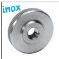
Versione bassa EMS-B