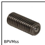
BPVMss Sfera portante avvitabile miniatura, Miniatura ad avvitare