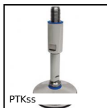
PTKss Piede speciale agroalimentare, Inox -