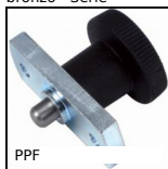
PPF Pistoncino a molla, con flangia