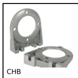
CHB Feet, For CHB gearbox