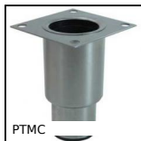
PTMC Telescopico furniture foot, square plate