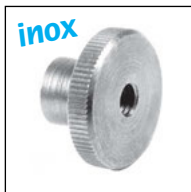
Versione alta EMS-H