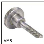
VMS Volantino zigrinato, Zigrinato