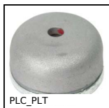
PLC_PLT Magnete, Con foro centrale