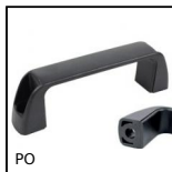
PO Maniglia a ponte - Multi-settore, Foro liscio