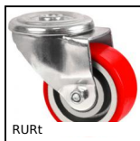
RURt Ruota girevole a foro centrale, Poliuretano -