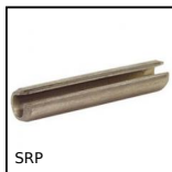
SRP Spina cilindrica ISO8752, elastica ISO 8752