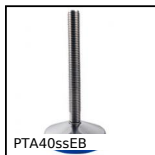
PTA40ssEB Articulated foot whit sheet metal base Ø40, Ø 40