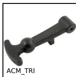
ACM_TRI Tirante chiusura in gomma, Caucciù