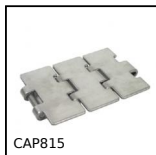
CAP815 Catena a tapparella dritta, Stretta serie 815