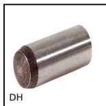
DH Spina cilindrica, standard DIN 6325