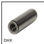
DHX Spina cilindrica filetto interno, estraibile DIN 7979D