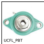
UCFL_PBT Cuscinetto a flangia ovale Polimero inox, Polimero e inox