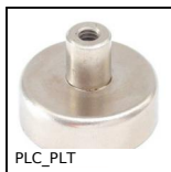
PLC_PLT Magnete, Con foro maschiato