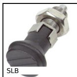
SLB Pistoncino a molla, inox