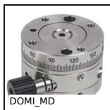
DOMI_MD Tavola rotante di regolazione Domino, 55/1