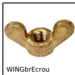
WINGbrEcrou Dado ad alette per serraggio manuale DIN315, Ottone DIN 315