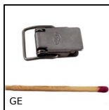
GE Chiusura a leva, Miniature