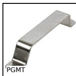
PGMT Maniglia a ponte a fissaggio anteriore, Inox