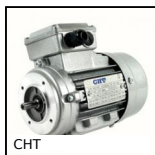
CHT Motore AC asincrono trifase, 1.1 a 1.85kW