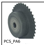
PCS_PA6 , 12.7mm (DIN 08B-1)