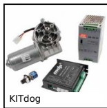
KITdog Kit di motorizzazione 24V, Ruota e vite senza fine