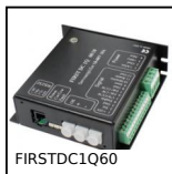
FIRSTDC1Q60 Variatore di velocità 10A, 10 A