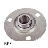
BPF Supporto a flangia tonda con cuscinetto, Lamiera