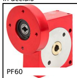
PF60 Riduttore a ruota e vite senza fine, fino a 118 Nm