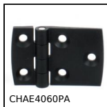
CHAE4060PA Cerniera ad avvitare estetica asimmetrica, Poliammide