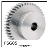
PSG05 Ingranaggio dritto di precisione, Acciaio 20NCD2 cementato temprato