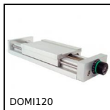
DOMI120 Slitta di regolazione Domino 120, Slitta DOMILINE 120