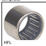
HFL Ruota libera, Combinata ad aghi