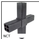
NCT Giunto di collegamento, Ad angolo fisso