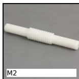
M2 Coppia ruota e vite senza fine, Plastica lavorata (delrin)