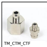
TM_CTM_CTF Accessori per ventosa, Inserto per ventosa - A scatto