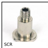
SCR Accessori per ventosa, Inserto per ventosa - Vite cava