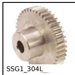
SSG1_304L Ingranaggio dritto Inox, Inox 304L