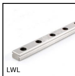
LWL Guida lineare a sfere - Sfere inox, Binario - da 514 N a 16700 N