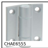
CHAE6555 Cerniera ad avvitare estetica, Alluminio