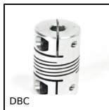
DBC Panamech, Multi-Beam, Alluminio - con ganascia di serraggio