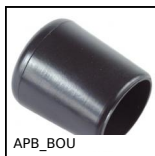
APB_BOU Asse per morsetti, Tappo di sicurezza