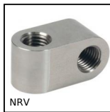
NRV Morsetto incrociato, Montaggio e regolazione rapidi