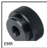
EMR Volantino zigrinato a serraggio rapido, Zigrinato