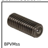
BPVMss Sfera portante avvitabile miniatura, Miniatura ad avvitare