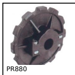
PR880 Ruota di rinvio, Serie 880