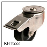
RHTtcss Ruota alte temperature, fino a 200kg