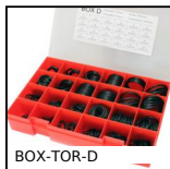
BOX-TOR-D Valigetta di guarnizioni toriche in nitrile, 18.00 x 2.00mm a 50.00 ...