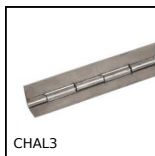
CHAL3 Cerniera piana, Acciaio