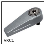
VRC1 Staffa di bloccaggio 1 lato, 1 lato