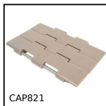
CAP821 Catena a tapparella dritta, Larga serie 821