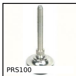
PRS100 Piede snodabile tutto inox Ø100, Ø 100