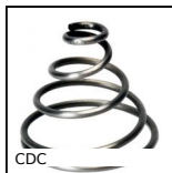
CDC Molla di compressione conica, Conica