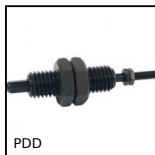
PDD Pressore a molla sensore di rilevamento, Con asta di comando per int...