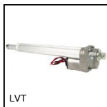
LVT Mini martinetto motorizzato 2A, 2 ampere