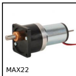
MAX22 Motoriduttore DC 12V e 24V DC, da 0,07 a 0,2Nm