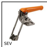
SEV Attrezzo di bloccaggio a tirante, A tirante verticale - inox