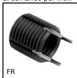
FR Inserti filettati, Acciaio