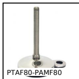
PTAF80-PAMF80 Piede fissabile con base lamiera Ø80, Ø 80