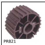
PR821 Ruota di rinvio, Serie 821 e 805