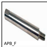
APB_F Perno di fissaggio per morsetti, Filettato