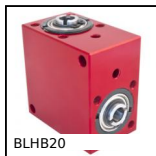
BLHB20 Rinvio angolare ad albero cavo, fino a 4.4 Nm