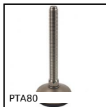
PTA80 Piede snodato con base stampata Ø80, 10000N