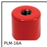
PLM-16A Magnete, Con foro maschiato