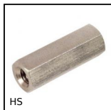
HS Distanziatore esagonale, Inox 303