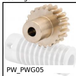
PW_PWG05 Ruota di precisione, Bronzo