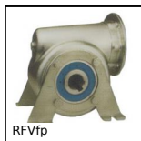
RFVfp Riduttore inox a ruota e vite senza fine, Piede di supporto