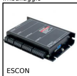
ESCON Variatore di velocità 5A, 5 A