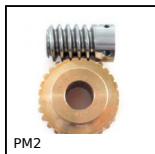
PM2 Coppia ruota e vite senza fine, Bronzo