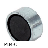
PLM-C Magnete piatto di fermo, Magnete di fermo piatto