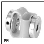
PFL P-FLEX, Vite a pressione