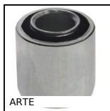
ARTE Silent block, Carico multidirezionale