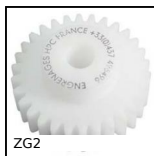
ZG2 Ingranaggio dritto in plastica, Plastica lavorata (delrin)