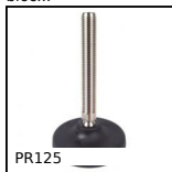
PR125 Piede fissabile con snodo - poliammide, Ø 123