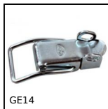
GE14 Chiusura a leva, Con porta-lucchetto