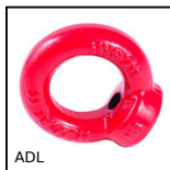
ADL Anello di sollevamento, Femmina