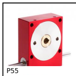
PS5 Riduttore a ruota e vite senza fine, fino a 57 Nm