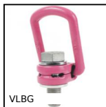
VLBG Anello di sollevamento, Girevole