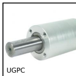
UGPC Unità di guida per cilindrico, Cuscinetto corto