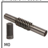
M0 Vite senza fine, Acciaio temprato