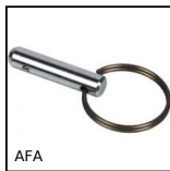
AFA Perno di fissaggio, con anello