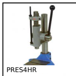
PRES4HR Pressa manuale da banco, Pressione fino a 600kg