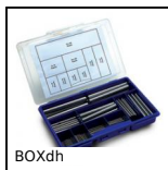
BOXdh Box kit di spine cilindriche DIN6325, Box kit - standard DIN 6325