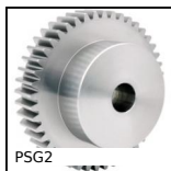
PSG2 Ingranaggio dritto di precisione, Acciaio 20NCD2 cementato temprato