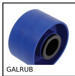
GALRUB Rullo per trasportatore, Caucciù