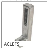
ACLEFS Elementi di ancoraggio, Standard