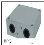
BPQ Quadro linear ball bearing unit, Included 4 linear ball bearings