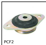
PCF2 Supporto antivibrante cabina conico, Piastra a base ovale