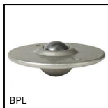
BPL Sfera portante con flangia, Leggero