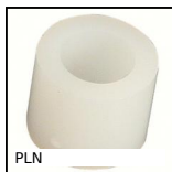
PLN Distanziatore cilindrico, termoplastica