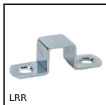
LRR Chiavistello con perno prismatico, Gancio