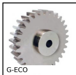
G-ECO Ingranaggio dritto acciaio - serie ECO, Acciaio C45