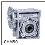
CHM50 Riduttore a ruota e vite senza fine, fino a 107 Nm