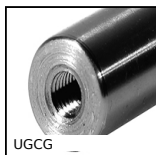
UGCG Unità di guida per cilindrico, Colonna di guida