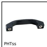
PHTss Maniglia a ponte, Fino a 250°C