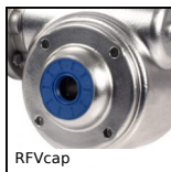
RFVcap Coperchio di protezione inox, Coperchio di protezione aperto