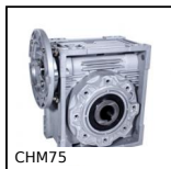
CHM75 Riduttore a ruota e vite senza fine, fino a 298 Nm