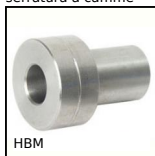
HBM Guida su semi-binari, Boccola di regolazione