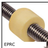
EPRC Dado cilindrico a passo lungo, Dado cilindrico-fino a 40mm di corsa ...