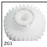
ZG1 Ingranaggio dritto in plastica, Plastica lavorata (delrin)