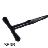
SERB Interblocco di sicurezza, Chiave universale per serratura a camme