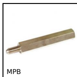
MPB Distanziatore esagonale, Ottone