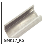
GMK17_RG Morsetto di giunzione, Per guida prodotto laterale