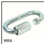
MRA Maglia rapida, Acciaio