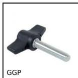
GGP Vite ad alette, Tecnopolimero con inserto in inox