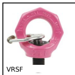
VRSF Anello di sollevamento, Orientabile maschio