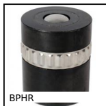
BPHR Sfera portante, Forte