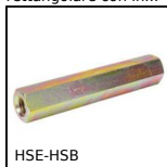
HSE-HSB Distanziatore esagonale, Acciaio