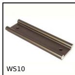
WS10 Guida modulabile Drylin® W, Binario