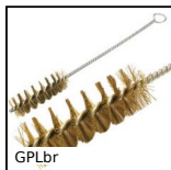
GPLbr Scovolo, ottone