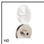
H0 Ingranaggio elicoidale ad assi incrociati a