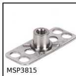
MSP3815 Inserto con piastrina a incollare Masterplate®, rettangolare con in...